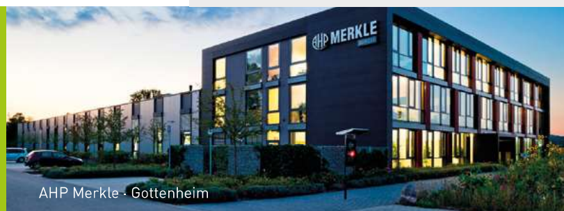
AHP Merkle - Gottenheim