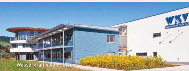
Wasserkraft Volk - Gutach