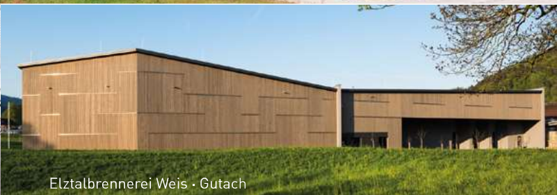
Elztalbrennerei Weis - Gutach